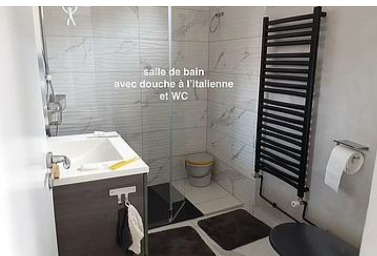
salle de bain avec douche à l'italienne et WC