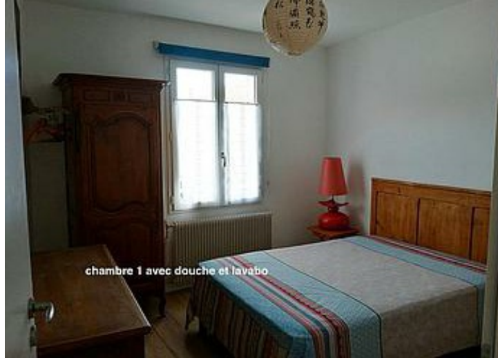
chambre 1 avec douche et lavabo