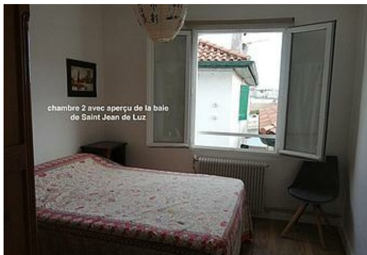
chambre 2 avec aperçu de la baie de Saint Jean de Luz