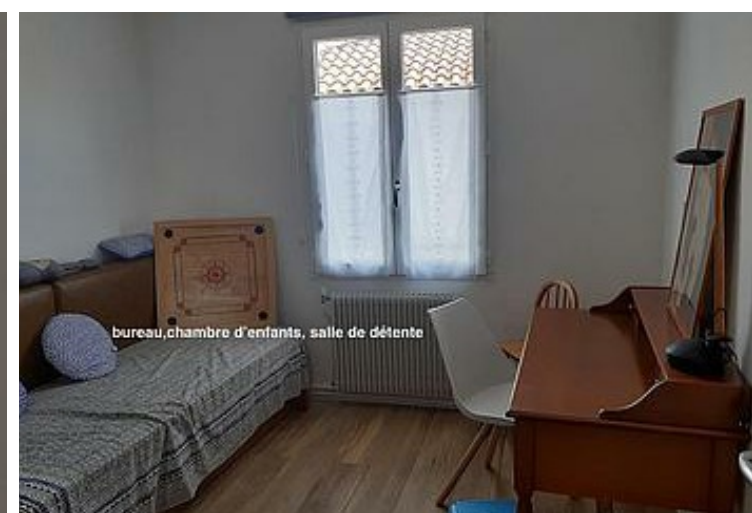
bureau, chambre d'enfants, salle de détente