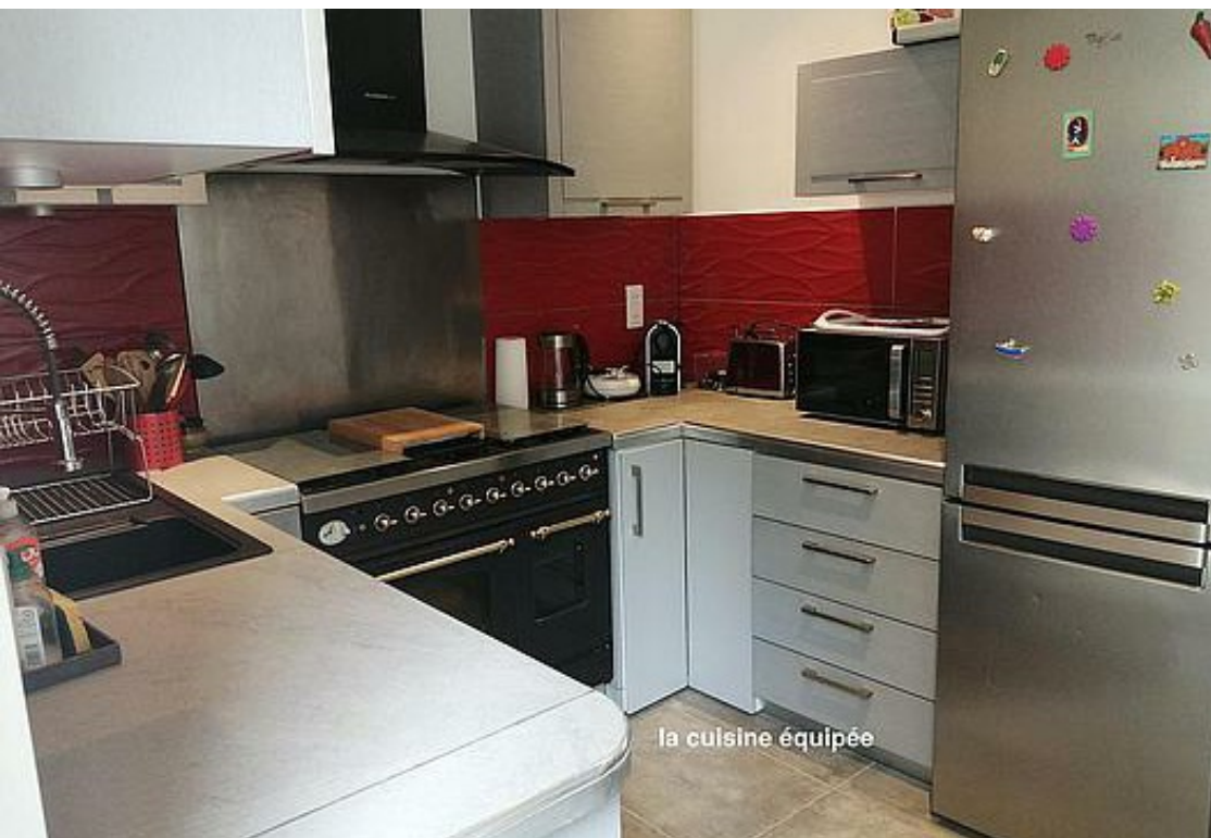
la cuisine équipée