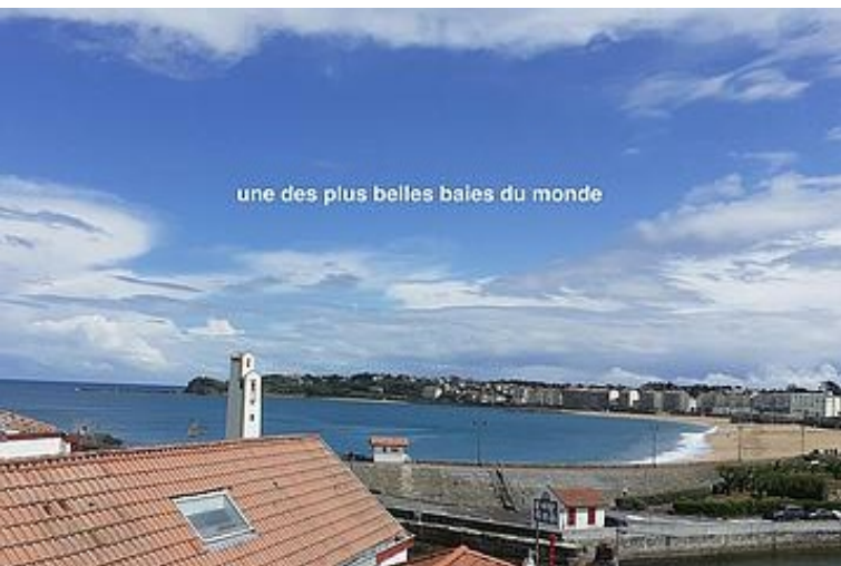
une des plus belles baies du monde