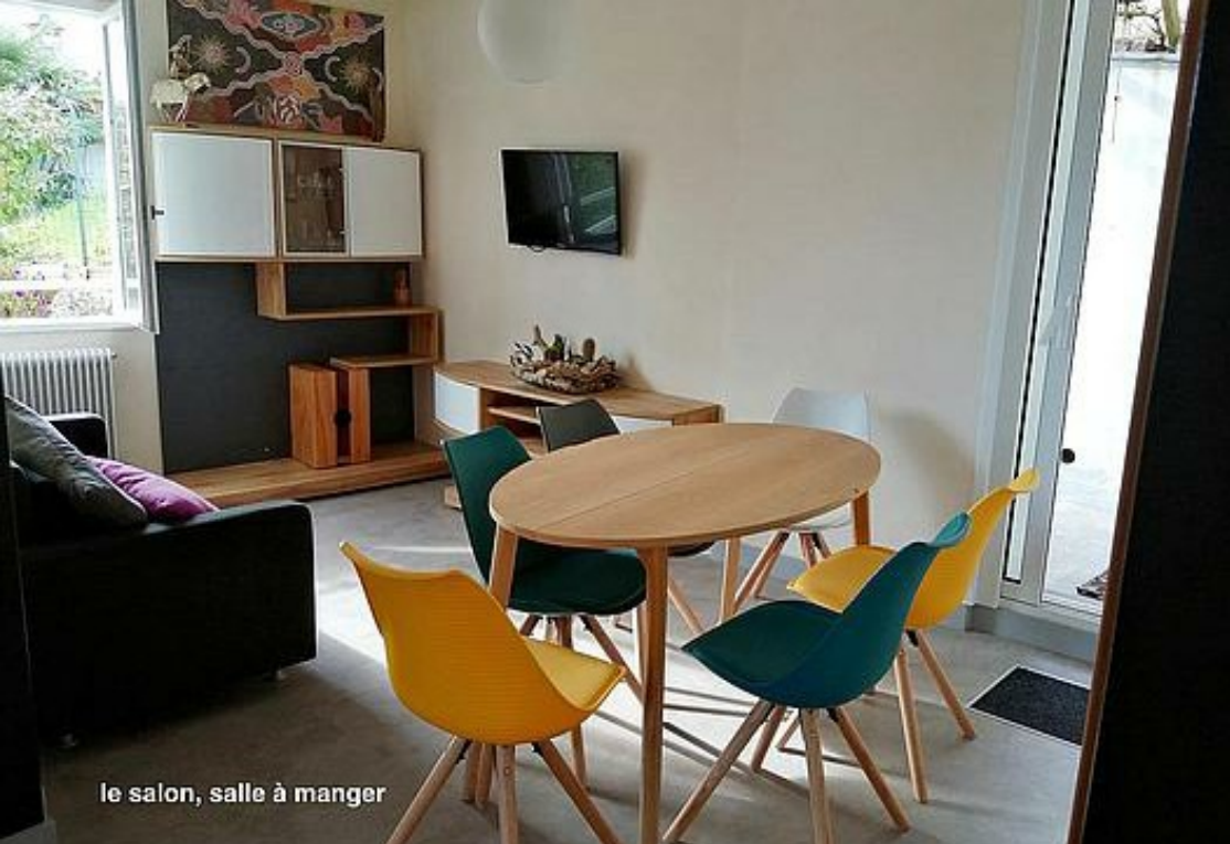
le salon, salle à manger