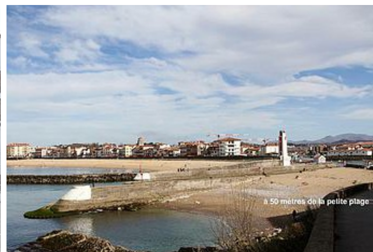
à 50 mètres de la petite plage