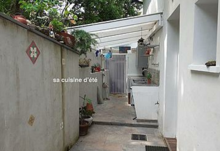
sa cuisine d'été