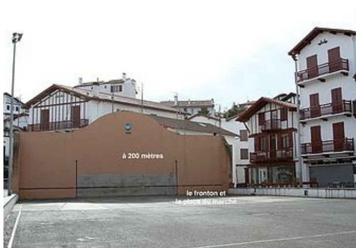
à 200 mètres